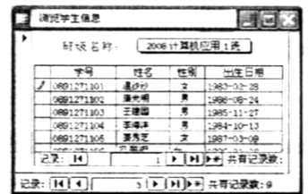
题 13 图