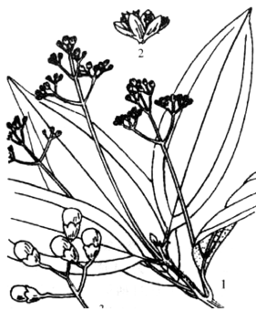
题 10 图

二、多项选择题:本大题共 5 小题,每小题 3 分,共 15 分。在每小题列出的备选项中至少有两项是符合题目要求的,请将其选出,错选、多选或少选均无分。