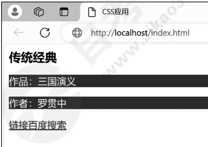
题 39 图